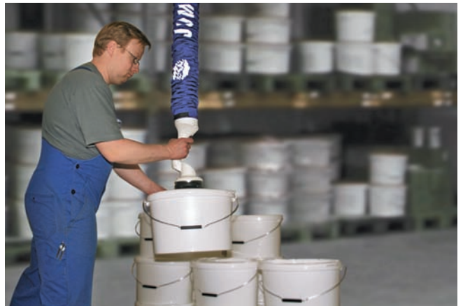
JumboFlex, максимальная грузоподъемность 35 кг, с круглой присоской для перемещения ведер