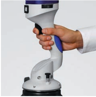
Встроенная кнопка для управления одним пальцем