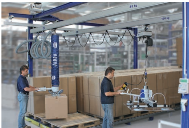
Алюминиевая крановая система с одной балкой, грузоподъёмностью 85 или 150 кг, рабочая зона 2x6 м или 4x6 м

Мы оказываем всесторонние услуги в области консультирования, проектного планирования, проверки и обслуживания оборудования, а это означает, что вы в надёжных руках.