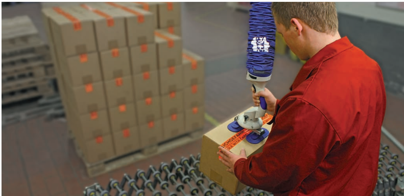
JumboFlex, максимальная грузоподъёмность 35 кг, с двойным захватом для перемещения картонных коробок

Гибкое и эффективное решение по перемещению предметов