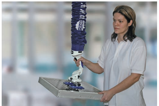
JumboFlex, максимальная грузоподъемность 35 кг, с двойным захватом для перемещения панелей солнечных батарей