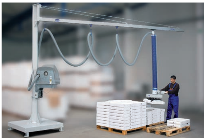
Поворотный кран на колонне с алюминиевой консолью, максимальная грузоподъёмность 65 кг, длина консоли 5 м с плитой-основанием