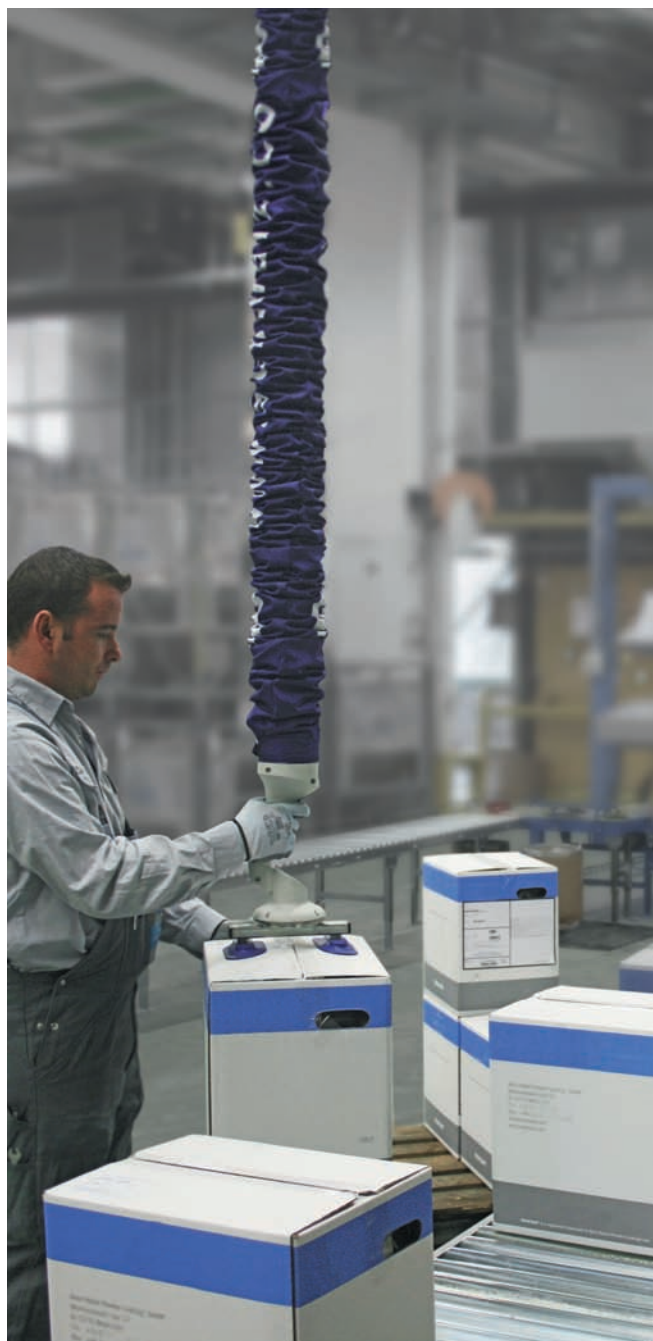
JumboFlex, максимальная грузоподъемность 35 кг, с двойным захватом для перемещения картонных коробок в зоне отгрузки