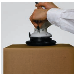
Вращение без ограничений