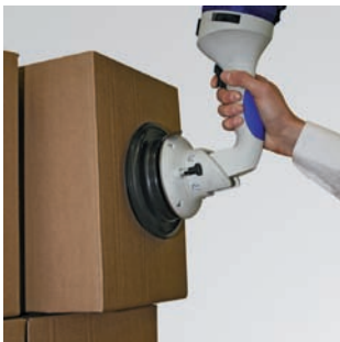
Гибкий захват и удерживание груза