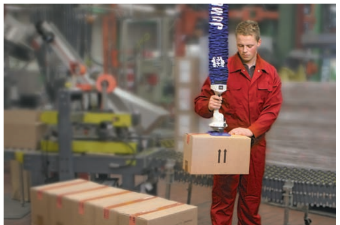
JumboFlex, максимальная грузоподъемность 35 кг, с двойным захватом для перемещения картонных коробок