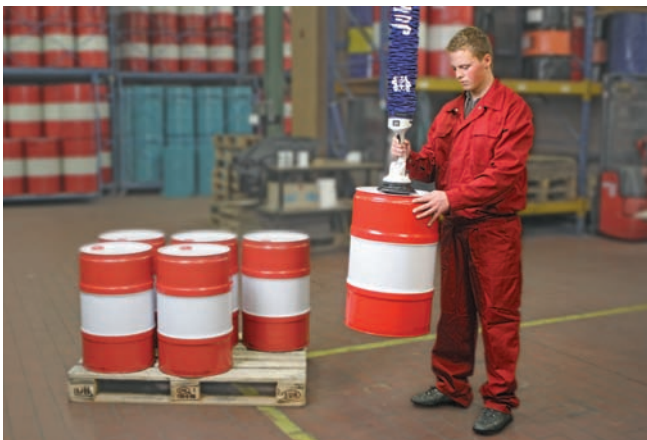
JumboFlex, максимальная грузоподъемность 35 кг, с круглой присоской для перемещения бочек