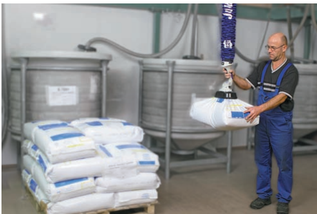
JumboFlex, максимальная грузоподъемность 25 кг, с присоской для перемещения мешков