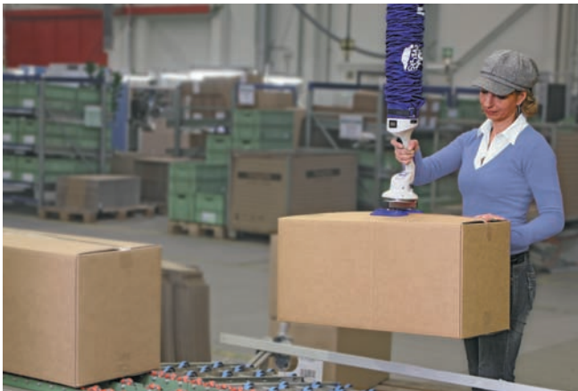
JumboFlex, максимальная грузоподъемность 35 кг, с двойным захватом для перемещения картонных коробок

Любой подъем и перемещение грузов одной рукой